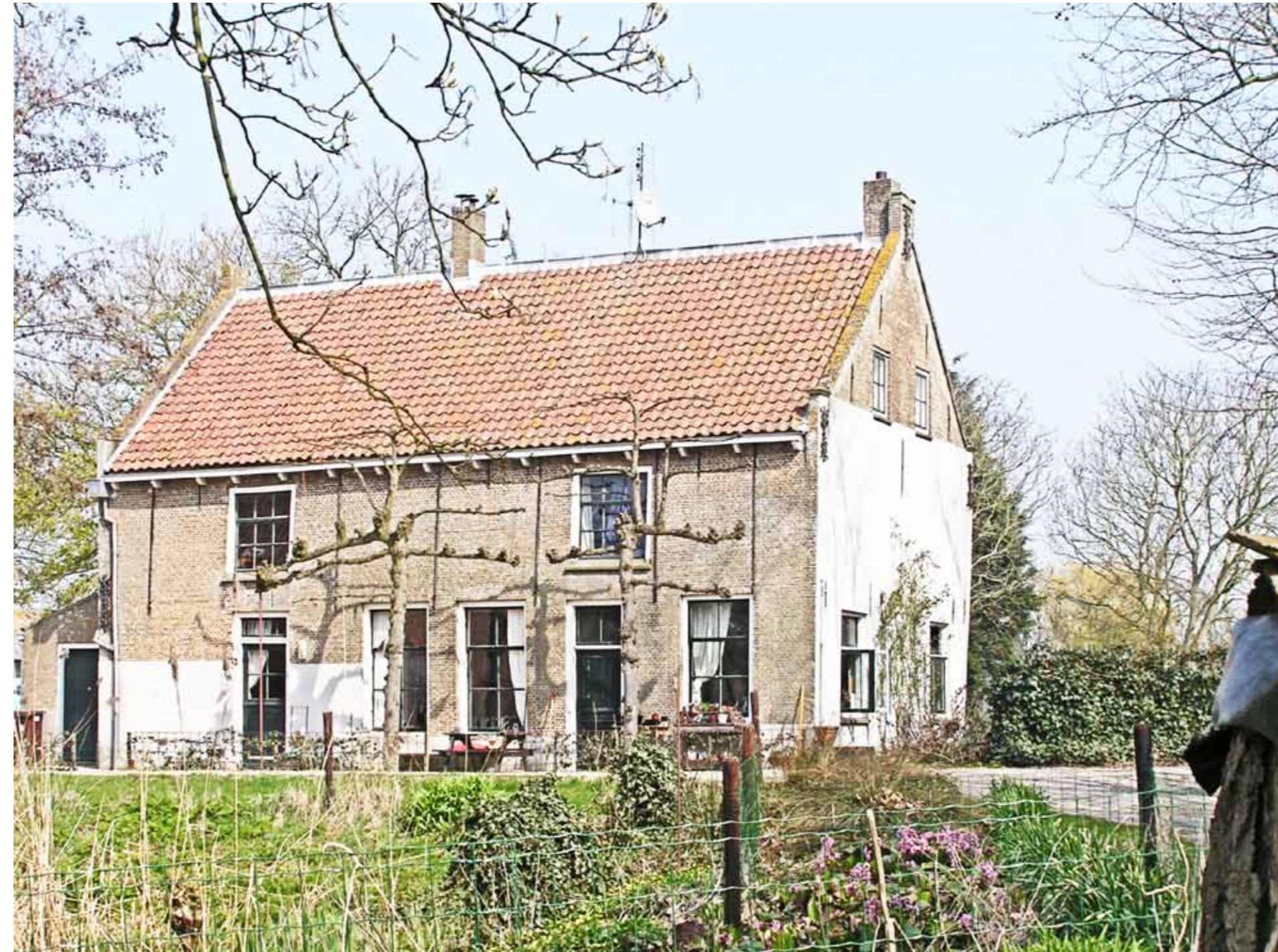
Lust en Last anno nu.

In Zeeland heerste een gunstiger belastingklimaat, wat Hollandse Flakkeërs met jaloerse blik naar Sommelsdijk deed kijken. In 1805 maakten de Fransen een eind aan deze bestuurlijke constructie. Vanaf dat moment is Sommelsdijk en dus ook de buurtschap Kralingen bij Dirksland, net als de rest van het eiland, Hollands. Toch sprak de familie Mijs tot ver in de twintigste