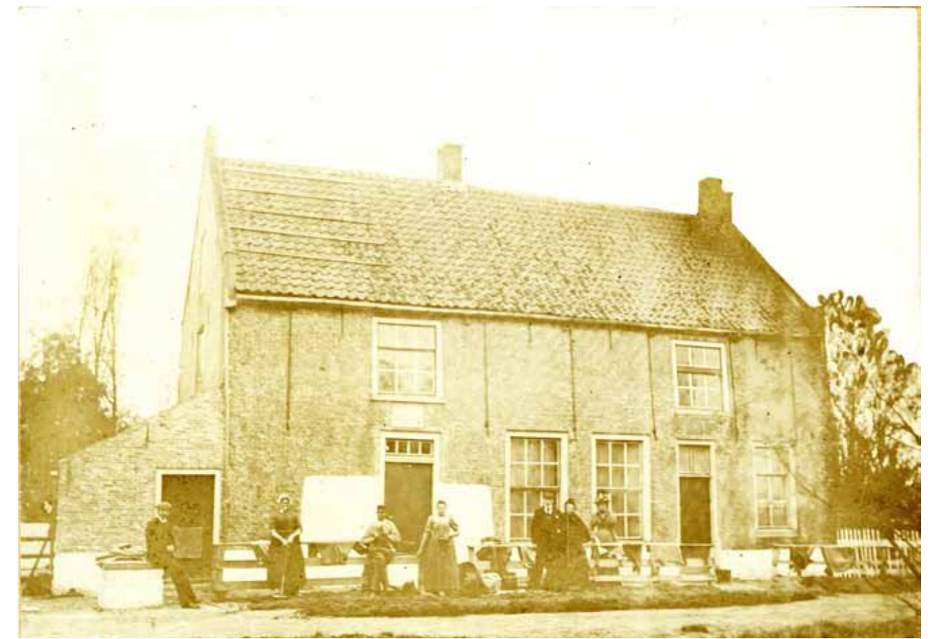
Lust en Last ongeveer honderd jaar geleden met haar toenmalige bewoners.