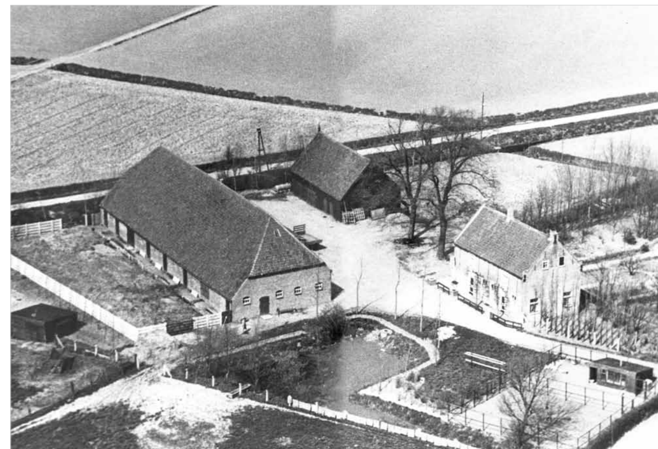
Luchtfoto van de hofstede, de opname is circa zestig jaar oud.