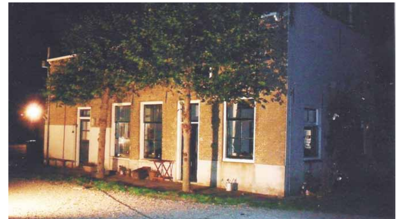
De boerderij tijdens de verlichte boerderijenroute.