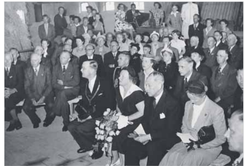
De bijeenkomst met koningin Juliana in de schuur van De Lind in Den Bommel na de ramp.

van de standsorganisatie LTB en bestuurder van de landbouwschool. Hij was acht jaar lid van de pachtkamer van het kantongerecht in Sommeldijk. "De eerste periode ben ik benoemd door koningin Juliana, de tweede door koningin Beatrix." Hij richtte een 'club' van jonge boeren op en participeerde in het bestuur van de rooms-katholieke basisschool St. Jozef in Achthuizen. "Ik was voorzitter en er was daar elke dag wel wat voor me te doen."