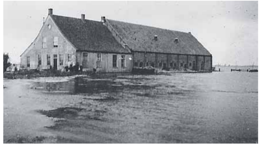
Het Groene Woud tijdens de watersnoodramp.