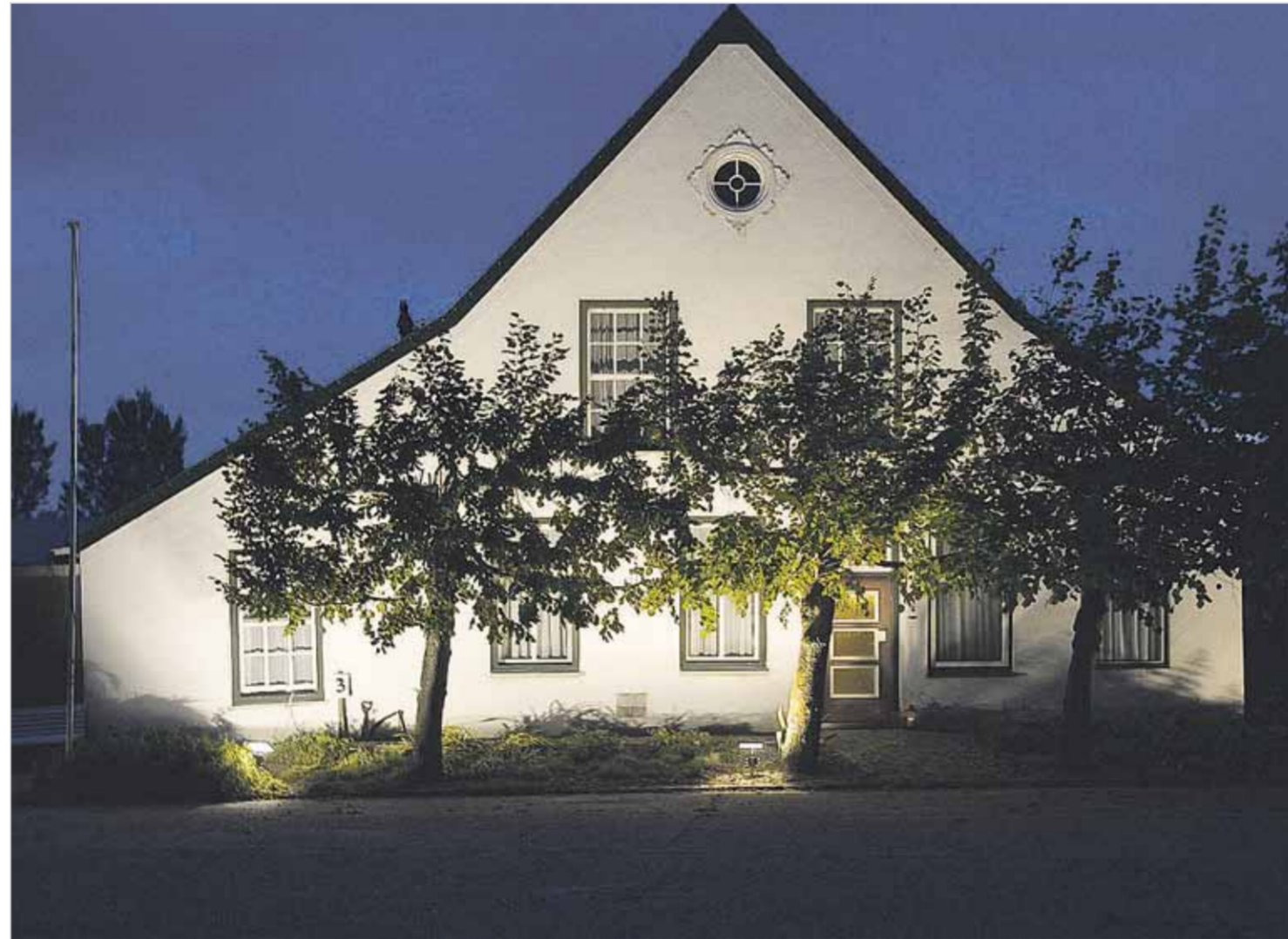
Het Groene Woud fraai verlicht tijdens de 'Verlichte boerderijenroute'.

"Het was vroeger een gemengd bedrijf. We hadden mestvee, dat in het voorjaar de deur uit ging, en