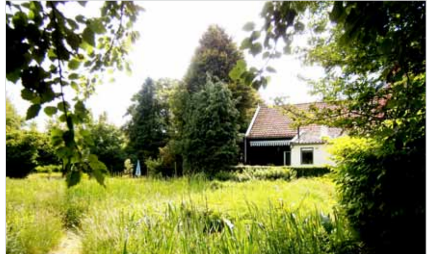
Het hof van Pau Heerschap.