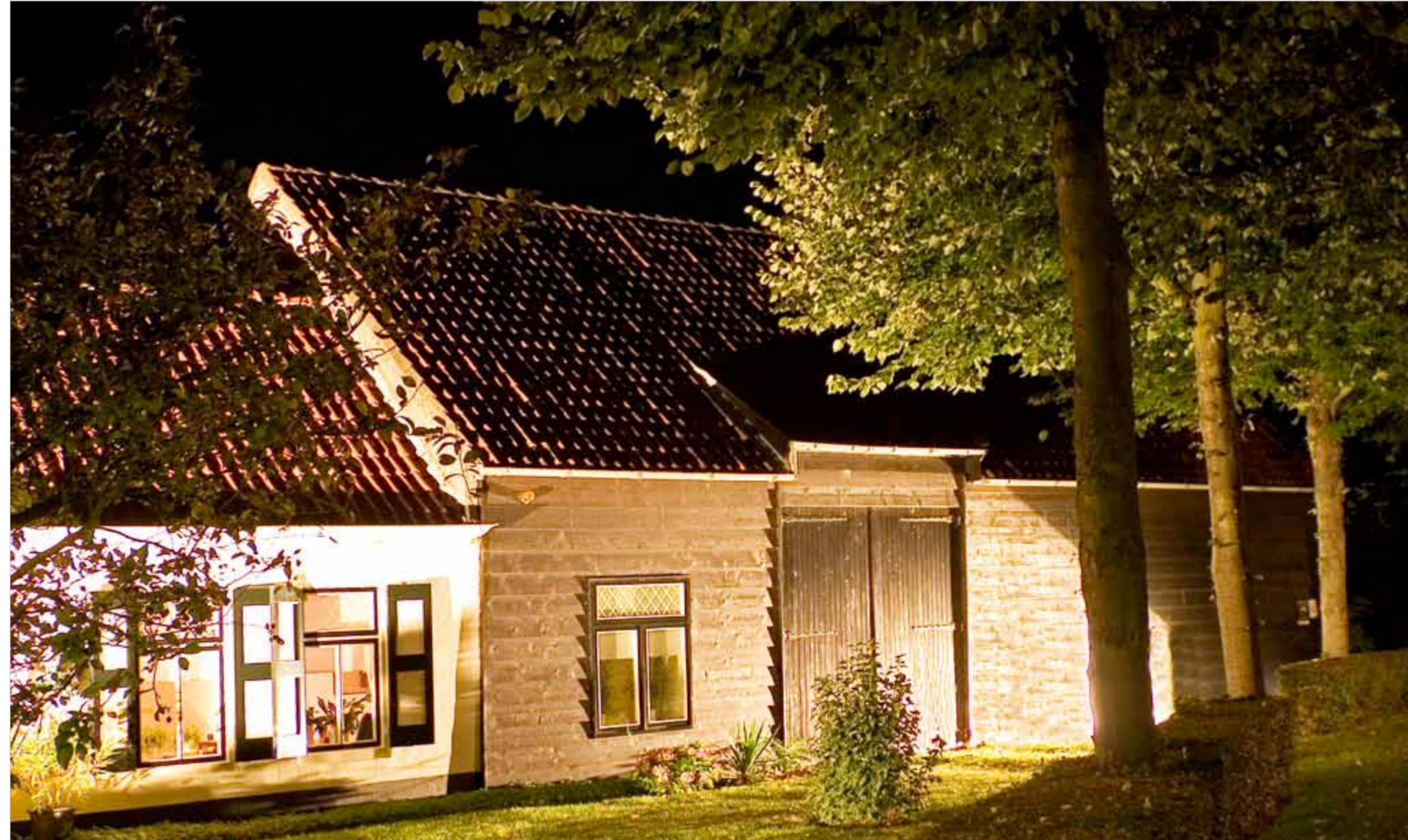
Kleine boerderij aan de Dirkdoensweg 15.

Het hof aan de Duinkerkerweg heeft tot 1990 bestaan. De opbrengst van de laatste anderhalve ruiters bruine bonen ging naar het toen armlastige Polen. Daarna maakte Pau er een natuurtuin van, met wilde bloemen. De oudere Ouddorpers konden het niet geloven. Zo’n goed hof, dat ga je toch niet bezaaïen met vuulte. “Maar het werd heel prachtig en toen zwegen ze”, lacht