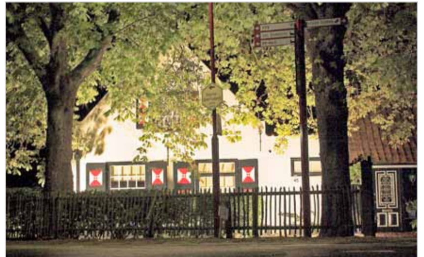
Boerderij aan de Dorpsweg 5.