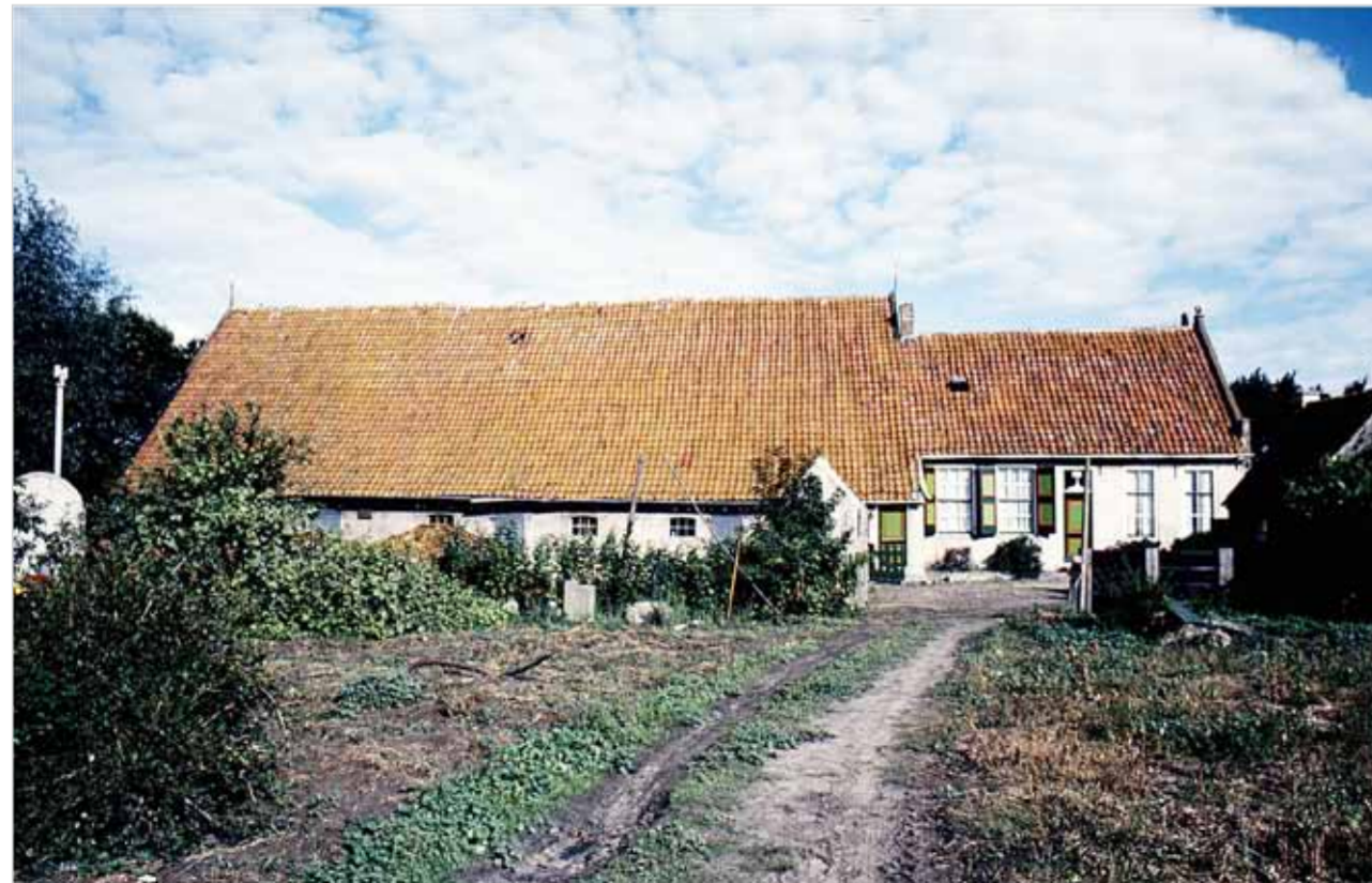
De Ridderstee, gebouwd in 1786.