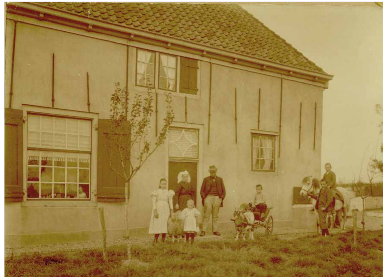
De Nagtegaal rond 1900 met de overgrootvader en -moeder van Pieter Warnaer. In de bokkenwagen zijn opa.